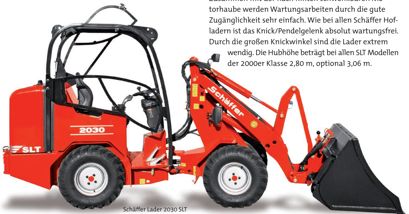
Schäffer Lader 2030 SLT

Neu ist auch die nach vorn klappbare Zwischenhaube. Zusammen mit der nach hinten schwenkbaren Motorhaube werden Wartungsarbeiten durch die gute Zugänglichkeit sehr einfach. Wie bei allen Schäffer Hofladern ist das Knick/Pendelgelenk absolut wartungsfrei. Durch die großen Knickwinkel sind die Lader extrem wendig. Die Hubhöhe beträgt bei allen SLT Modellen der 2000er Klasse 2,80 m, optional 3,06 m.