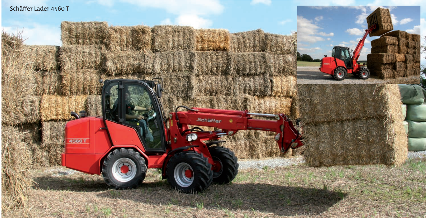
Schäffer Lader 4560 T

Mehr Komfort für lange Arbeitstage bieten die knickgelenkten Teleradlader 4560 T und 4580 T von Schäffer. Diese mit 4 t Einsatzgewicht sehr kompakten Maschinen sind mit einer neu gestalteten Kabine und den aktuellsten Dieselmotoren von Kubota ausgerüstet.